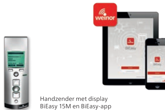
Handzender met display BiEasy 15M en BiEasy-app

De rondom gesloten en robuuste zonneschermcassette beschermt het doek en de technische uitrusting betrouwbaar tegen de weersomstandigheden . Zo beleeft u lange tijd plezier aan uw weersbescherming.