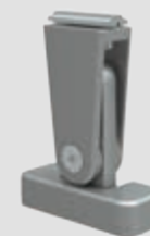
Steunvoet top, verstelbaar, in 3 hoogtes: 120–165, 165–210 en 210–255 mm