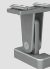
Steunvoet top voor serie-installaties, verstelbaar, in 3 hoogtes: 120–165, 165–210 en 210–255 mm