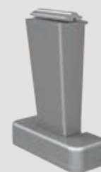
Steunvoet top, vast, in 4 hoogtes: 80, 120, 150 en 220 mm

WGM Top is leverbaar in de versies Stretch en OptiStretch , die voor een strak doek zorgen. Bij de uitvoering OptiStretch is het doek aan alle vier zijden vast gespannen. De voordelen: een bijzonder strak doek en geen lichtspleet aan de zijkanten. De basisversie Stretch is aan 2 zijden gespannen en tussen doek en zijprofiel bevindt zich een lichtspleet. Bij beide varianten zorgt een krachtig spansysteem met koorden voor een gelijkmatige doekstand.